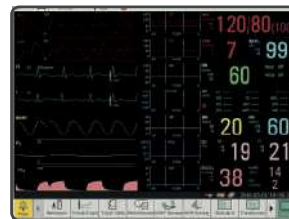
Pantalla de tendencias